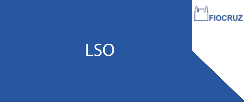
PDP 02 25x60CM