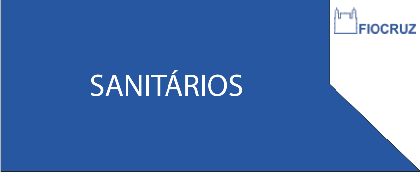
PDP 03 25x60CM