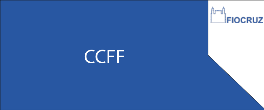
PDP 08 25x60CM