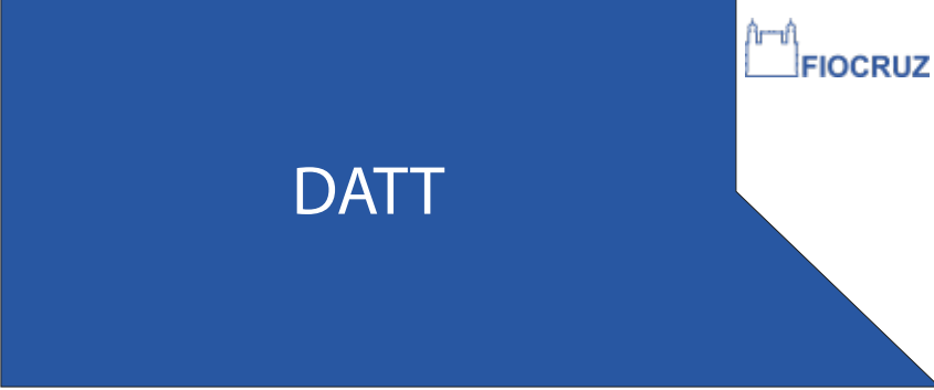
PDP 04 25x60CM