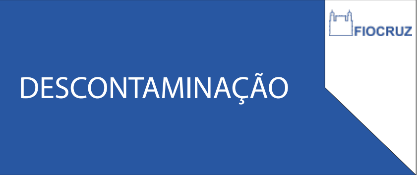
PDG 02 25x60CM