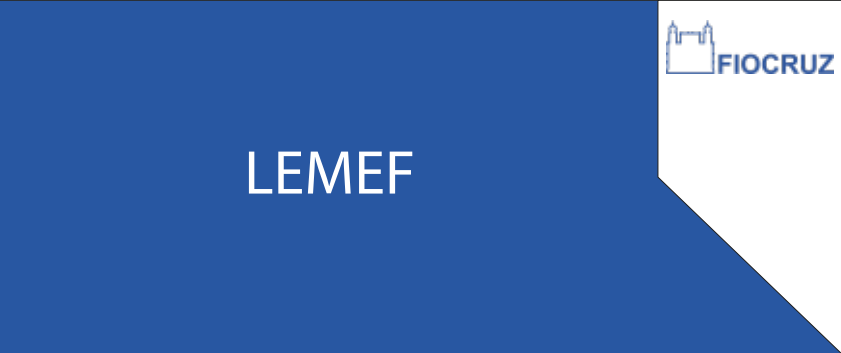
PDP 01 25x60CM