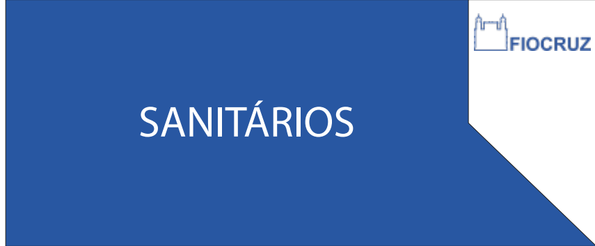
PDP 09 25x60CM