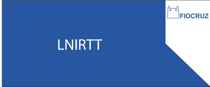
PDP 05 25x60CM