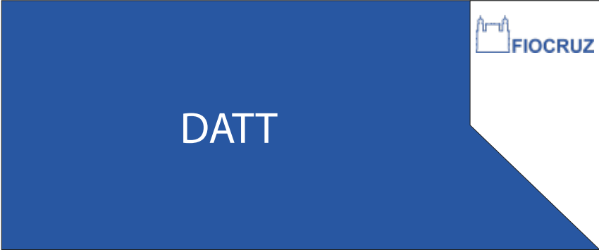
PDP 07 25x60CM