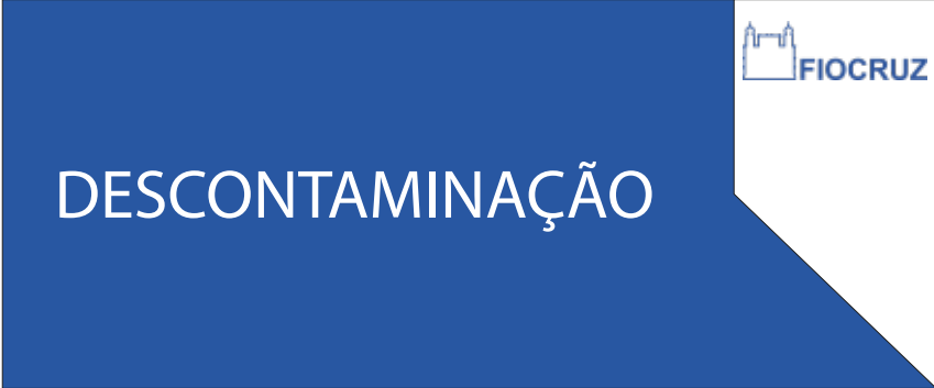
PDG 04 25x60CM