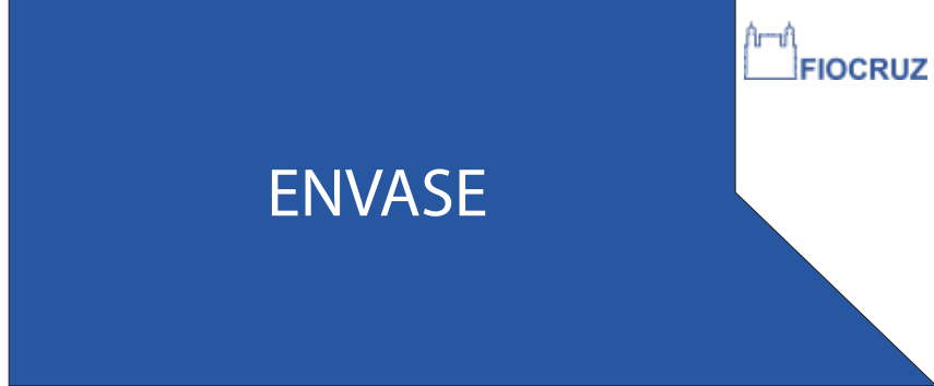
PDG 05 25x60CM