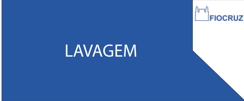
PDG 03 25x60CM