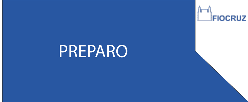
PDG 01 25x60CM