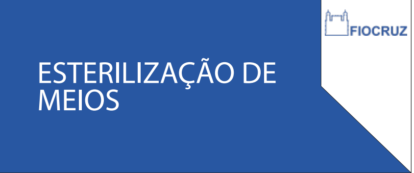
PDG 06 25x60CM

NOTAS 01 - TODAS AS DIMENSÕES ESTÃO EM CENTÍMETROS; 02 - CONFERIR DIMENSÕES DAS ESQUADRIAS IN LOCO PARA EXECUÇÃO DA CMV; 03 - EM CASO DE DÚVIDAS, CONSULTAR RESPONSÁVEL TÉCNICO.